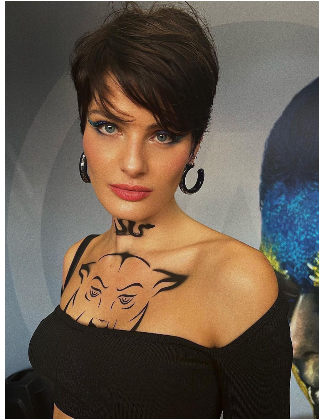
Isabeli Fontana para Lolla Palooza 2022