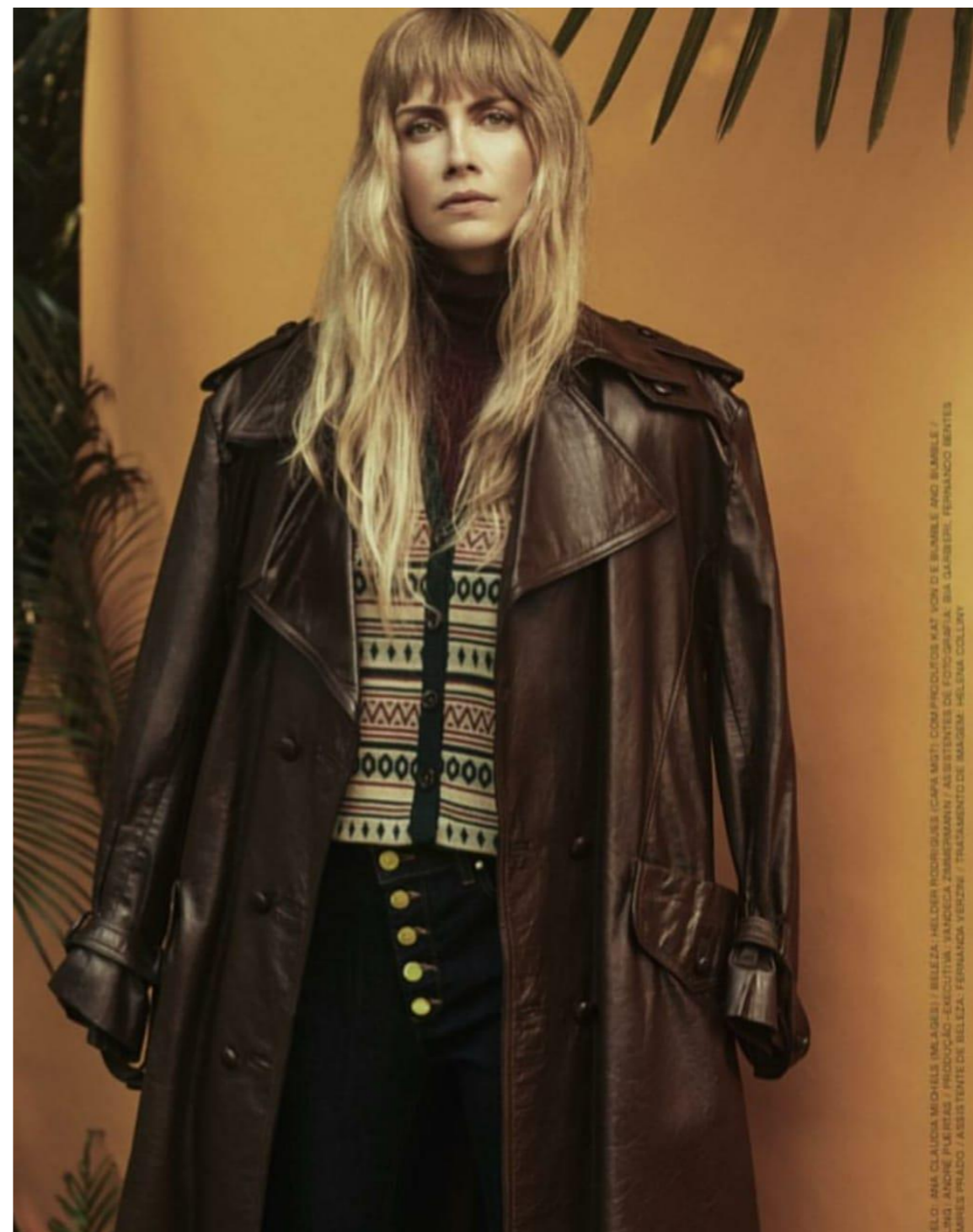
EDITORIAL MARIE CLAIRE DIA DAS MÃES