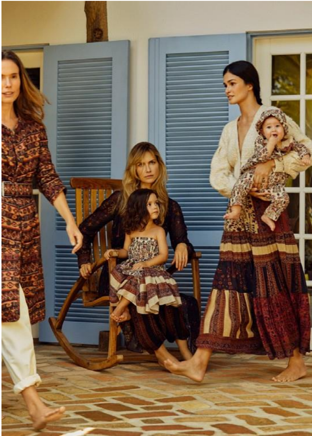
EDITORIAL VOGUE MARÇO 2019