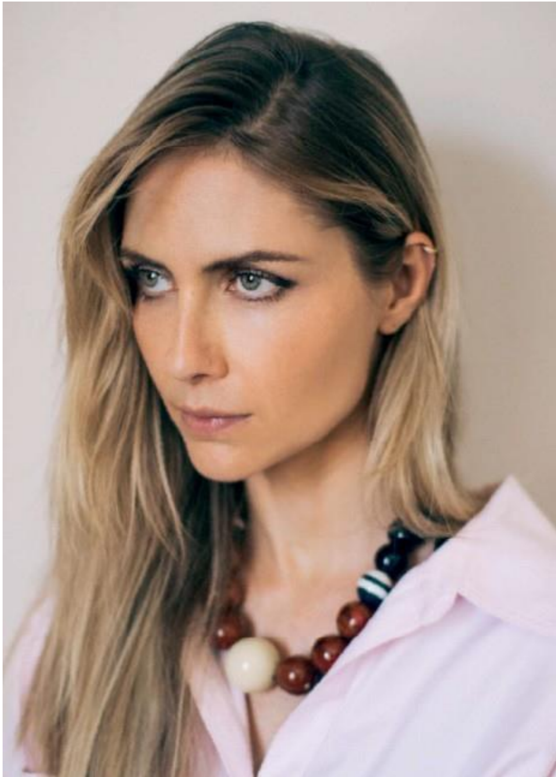
EDITORIAL RESVITA JP