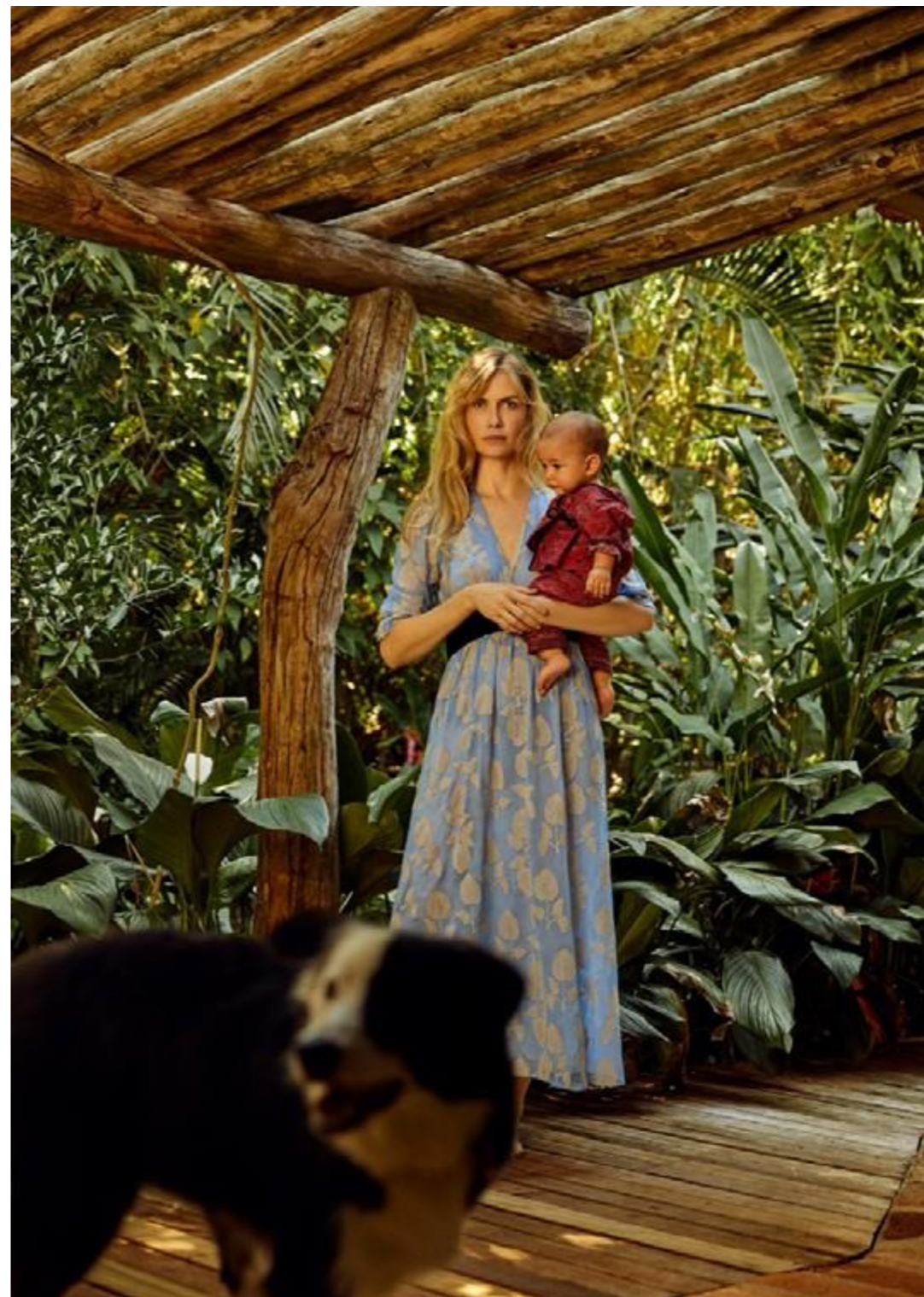
EDITORIAL VOGUE MARÇO 2019